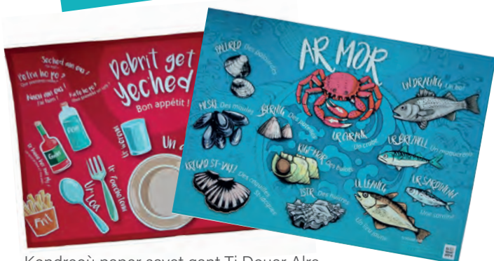
Kondreoù paper savet gant Ti Douar Alre

Kondreoù paper a implijoc'h ? Soñjit urzhiañ anezho d'ur grafour-ez brezhoneger-ez ar wech kentañ ho po ezhomm reoù nevez. Kondreoù a liv gant ho preti ha divyezhek ho po ! Tu zo ijinañ kondreoù evit ar vugale gant c'hoarioù pe liverezh e brezhoneg zoken !